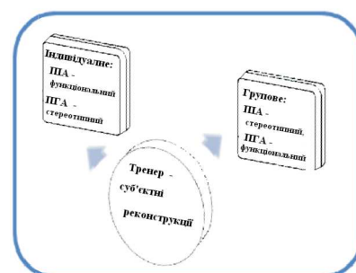
Модель зворотних суб'єктивних реконструкцій

Ці три концептуальні моделі утворюють загальну і спільну для всіх тренерів схему аналізу дискурсу в події. Так, перша модель стрижня події задає структури (компоненти, сфери і плани активності, як складові події) дискурсу, зокрема змістова, смислова і ресурсна сфери. Стрижнем події виступає розгортка в часі балансу спрямувань дискурсивних проявів [2]. Друга модель , яка стосується процесів розвантаження чуттєвої тканини в групі, описує три рівні цілісності, які визначають види компонентів (змістового, інтелектуального, персонального, взаємодії, взаєморозуміння і взаємоузго-