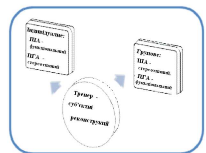
Модель зворотних суб'єктивних реконструкцій

Ці три концептуальні моделі утворюють загальну і спільну для всіх тренерів схему аналізу дискурсу в події. Так, перша модель стрижня події задає структури (компоненти, сфери і плани активності, як складові події) дискурсу, зокрема змістова, смислова і ресурсна сфери. Стрижнем події виступає розгортка в часі балансу спрямувань дискурсивних проявів [2]. Друга модель , яка стосується процесів розвантаження чуттєвої тканини в групі, описує три рівні цілісності, які визначають види компонентів (змістового, інтелектуального, персонального, взаємодії, взаєморозуміння і взаємоузго-