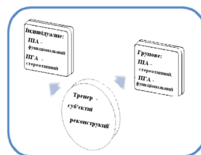
Модель зворотних суб'єктивних реконструкцій

Ці три концептуальні моделі утворюють загальну і спільну для всіх тренерів схему аналізу дискурсу в події. Так, перша модель стрижня події задає структури (компоненти, сфери і плани активності, як складові події) дискурсу, зокрема змістова, смислова і ресурсна сфери. Стрижнем події виступає розгортка в часі балансу спрямувань дискурсивних проявів [3, 51]. Друга модель , яка стосується процесів розвантаження чуттєвої тканини в групі, описує три рівні цілісності, які визначають види компонентів (змістового, інтелектуального, персонального, взаємодії, взаєморозуміння і взаємозгодження). Третя модель (зворотних реконструкцій) виражає варіативні складові дискурсу, а саме параметри позиції, контакту і спрямованості, завдяки яким здійснюється зворотна реконструкція індивідуальної чи групової суб'єктності . Концептуальні моделі визначають концептуальну схему аналізу дискурсу і одночасно слугують опорою обробки свідомості в ситуації знаходження тренера в потоці дискурсу в події.